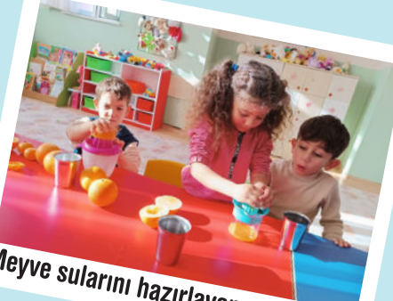
Meyve sularını hazırlayan minik eller