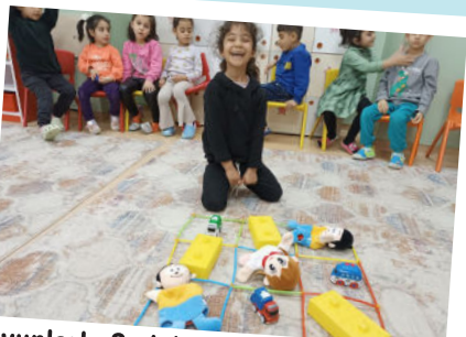
Oyunlarla Sudokuya giriş yapıyoruz