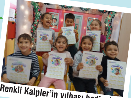
Renkli Kalpler'in yılbaşı hediyeleri