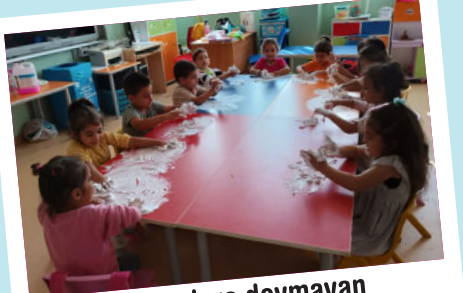
Duyusal oyunlara doymayan minik parmaklar