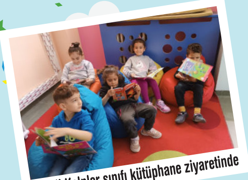
Renkli Kalpler sınıfı kütüphane ziyaretinde