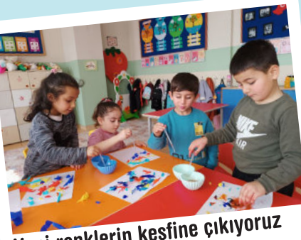
Yeni renklerin keşfine çıkıyoruz