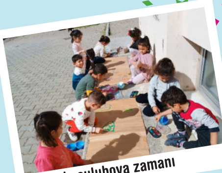
Bahçede suluboya zamanı