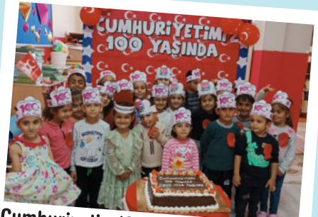
Cumhuriyetin 100. Yaşını kutluyoruz